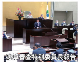
決算審査特別委員長報告