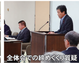
全体会での締めくくり質疑