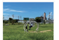
東部やすらぎ公園