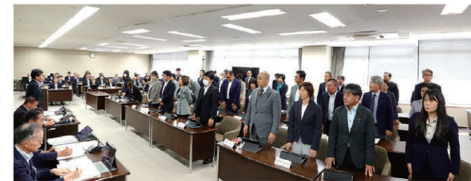
全体会での決算審査採決